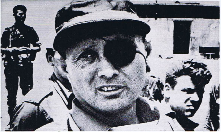
Der israelische Verteidigungsminister Moshe Dajan an der Front im Sechs-Tage-Krieg 1967 (zu: Aufmarsch zum dritten Weltkrieg, S. 124)